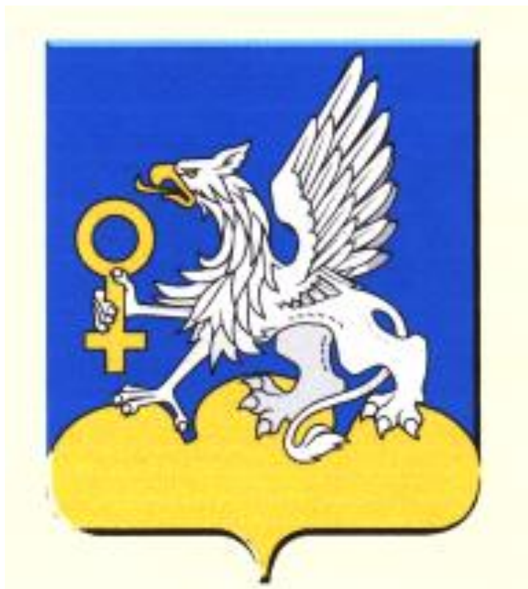
Схема теплоснабжения ГОРОДСКОГО ОКРУГА ВЕРХНЯЯ ПЫШМА на период с 2020 по 2035 год Том 1 Схема теплоснабжения