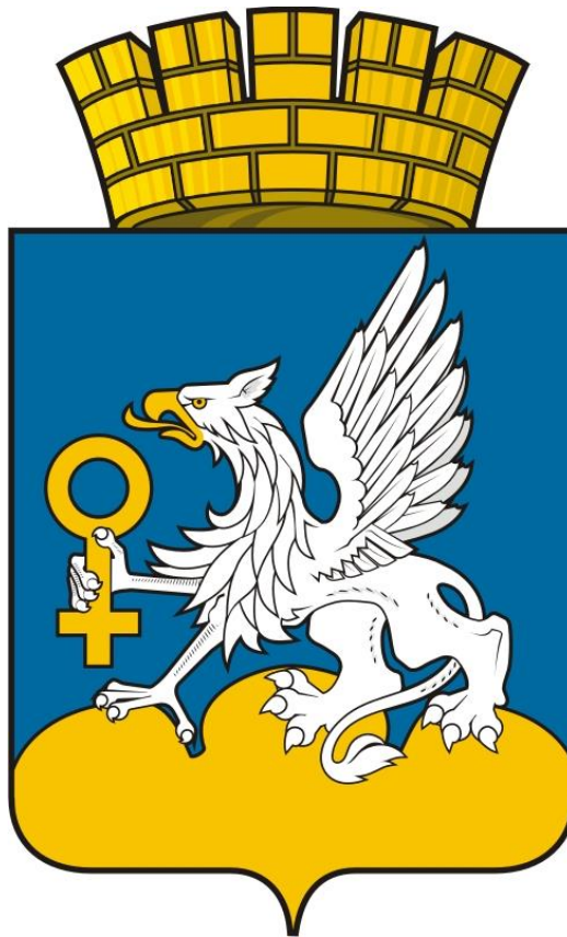
Схема теплоснабжения ГОРОДСКОГО ОКРУГА ВЕРХНЯЯ ПЫШМА на период с 2020 по 2035 год Том 1 Схема теплоснабжения