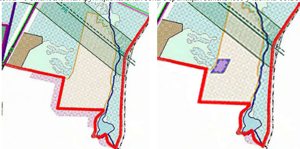
Рисунок 2-1 - Функциональная зона в границах земельного участка 66:36:3201002:401 до внесения изменений и после внесения изменений