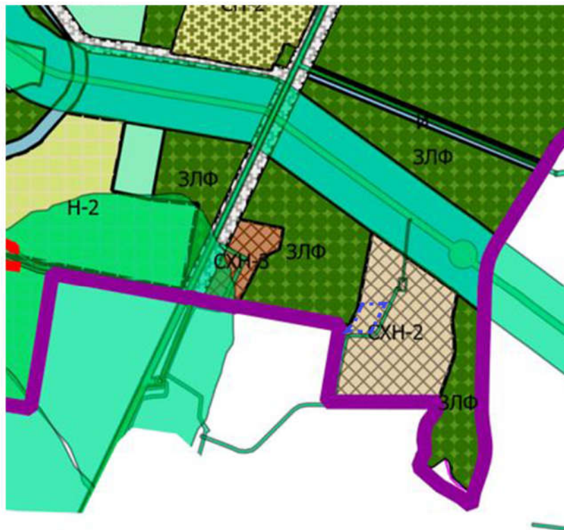
Рисунок 1 - Установленная территориальная зона в границах земельного участка 66:36:3201002:401

СХН-2. Зона сельскохозяйственного использования населением - территории, предназначенные для размещения индивидуального огородничества и выпаса сельскохозяйственных животных без возможности возведения зданий и сооружений сезонного