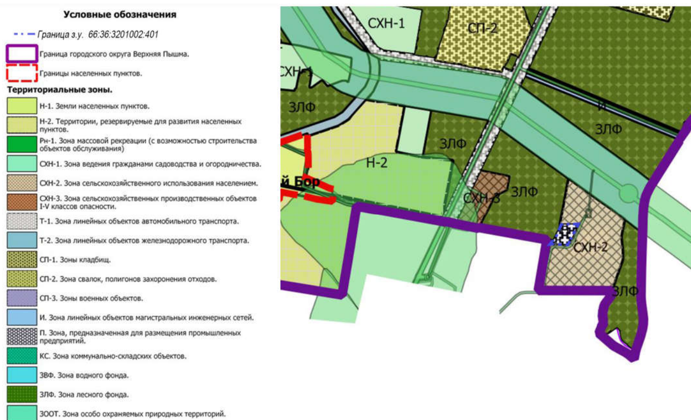
Рисунок 2 - Установленная территориальная зона в границах земельного участка 66:36:3201002:401.

4.1.1. Установить территориальную зону «П» на рассматриваемую территорию в соответствии с фрагментами (Рисунок 2, 2-1) и каталогом координат (Таблица 2).