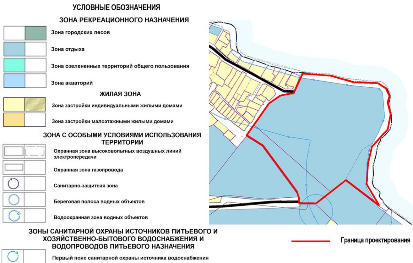
Рисунок 1 – Фрагмент Генерального плана в действующей редакции.

3.1. Согласно Генеральному плану городского округа Верхняя Пышма, применительно к территории п. Санаторный, утвержденному Решением Думы городского округа Верхняя Пышма от 26.02.2010 №16/1 (в редакции от 22.07.2021 № 38/9), в границах Проекта установлены функциональные зоны: «Зона рекреационного назначения (Зона отдыха)»; «Зона с особыми условиями использования территории (Береговая полоса водных объектов, Водоохранная зона водных объектов, Прибрежная защитная полоса)», «Зона санитарной охраны источников питьевого водоснабжения и водопроводов питьевого назначения (Первый пояс санитарной охраны источника водоснабжения)» (Рисунок 1):